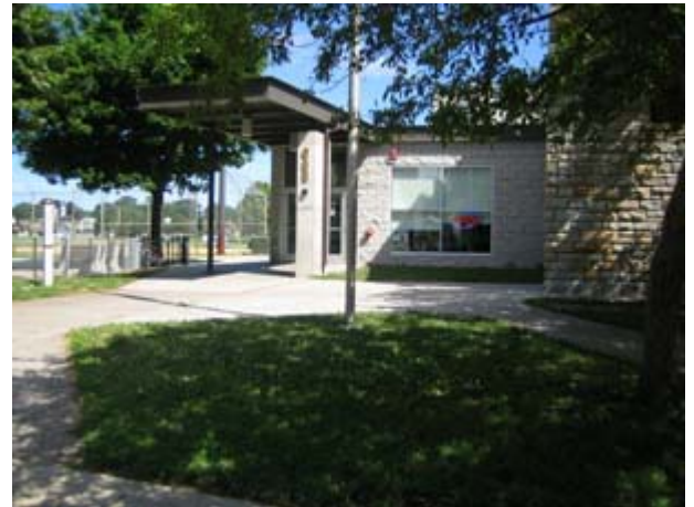
West Minnehaha Recreational Center

Châu Thái Bình Dương (Asian Pacific Endowment) của St. Paul Foundation. Để biết thêm chi tiết và phiếu ghi danh Việt ngữ hay Anh ngữ, xin vào trang nhà http://www.vietnam-minnesota.org hoặc gọi đường dây Đặc Biệt (612) 735-8576.